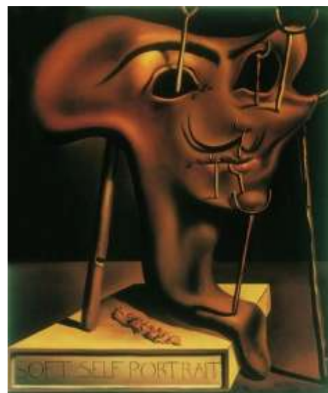
Figura 3. Salvator Dalì, Self Portrait with Grilled Bacon , 1941

Alle tre fonti di infelicità individuate in precedenza dobbiamo aggiungere anche una profonda delusione per aver preso coscienza del fatto che i progressi straordinari nelle scienze naturali e nelle loro applicazioni tecniche non ha aumentato affatto la quantità di piacere, soddisfazione e benessere percepito: